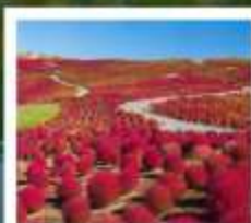
HITACHI SEASIDE PARK