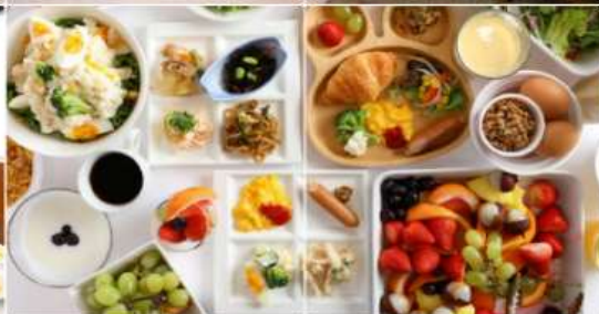
HOTEL B Suites