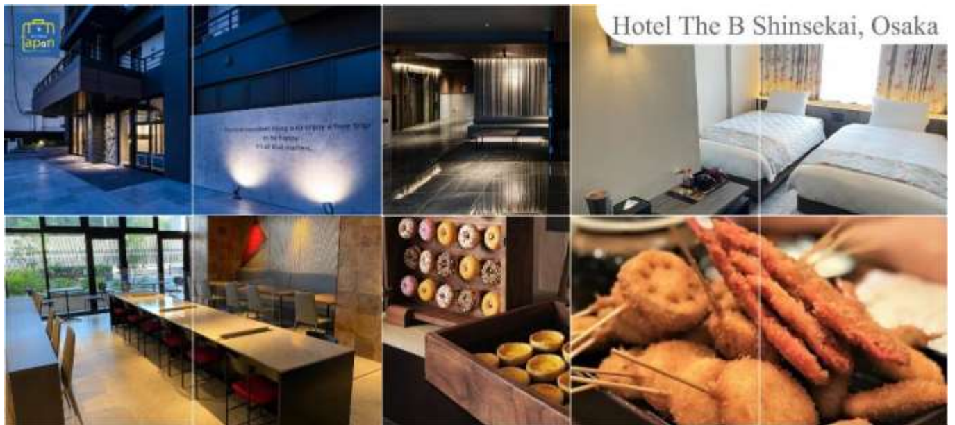
Hotel The B Shinsekai, Osaka

พักที่ HOTEL THE B SHINSEKAI, OSAKA หรือเทียบเท่าระดับเดียวกัน