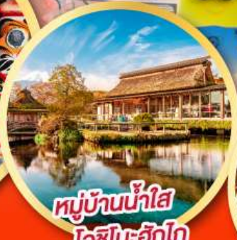
หมู่บ้านน้ำใส โอชิโนะอิกโก