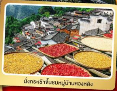
นั่งกระเช้าขึ้นชมหมู่บ้านหวงหลิง