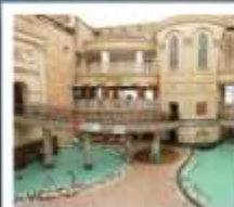
HAWAII SPA RESORT