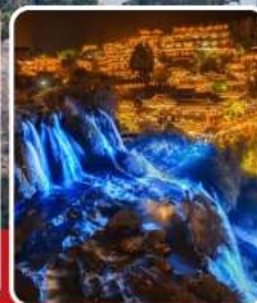
ฝูหลงเจิน