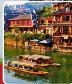
เมืองโบราณฝ่งหวง

เที่ยวฟิน 2 เมืองโบราณ พิชิตเขาวงตาร แพนดอร่าของเมืองจีน