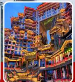
ตึก 72 ชั้น

อุทยานฉางเจียเจีย เขากียนจื่อซาน สะพานหนึ่งโถงในใต้หล้า ทะเลสาบเป่าเฟิงหู ตึกมหัศจรรย์ 72 ชั้น เมืองโบราณฝูหลงเจิน เมืองโบราณฝ่งหวง ล่องเรือแม่น้ำถิวเจียง สะพานสายรุ้ง ซ้อปี้ง ถนนคนเดินหวงซิงอู่