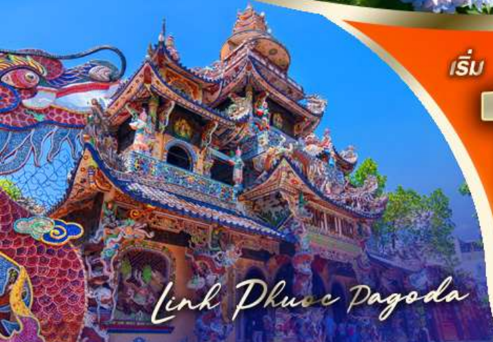
Linh Phuoc Pagoda